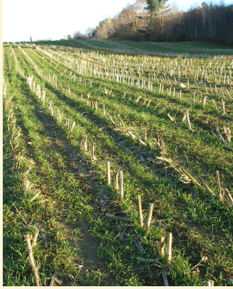
缅因州农场的免耕玉米残茬上生长着一种覆盖作物。